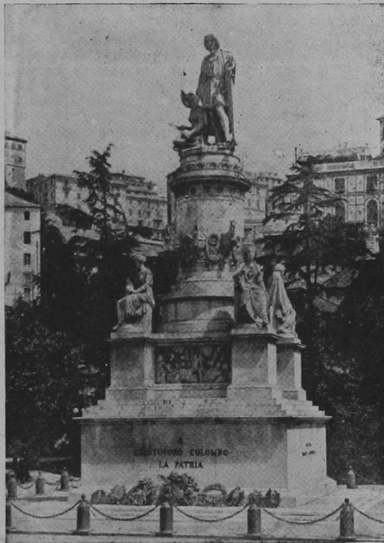
Monumento erigido en Génova a la memoria del gran navegante Cristóbal Colón

Caída Génova bajo el poder de los austriacos, el pueblo ligur no perdió su coraje legendario y esperaba con fe titánica el momento de rescatarse. En la tarde del 5 de diciembre de 1746 en uno de los barrios de la ciudad se había encallado un carro que había cedido